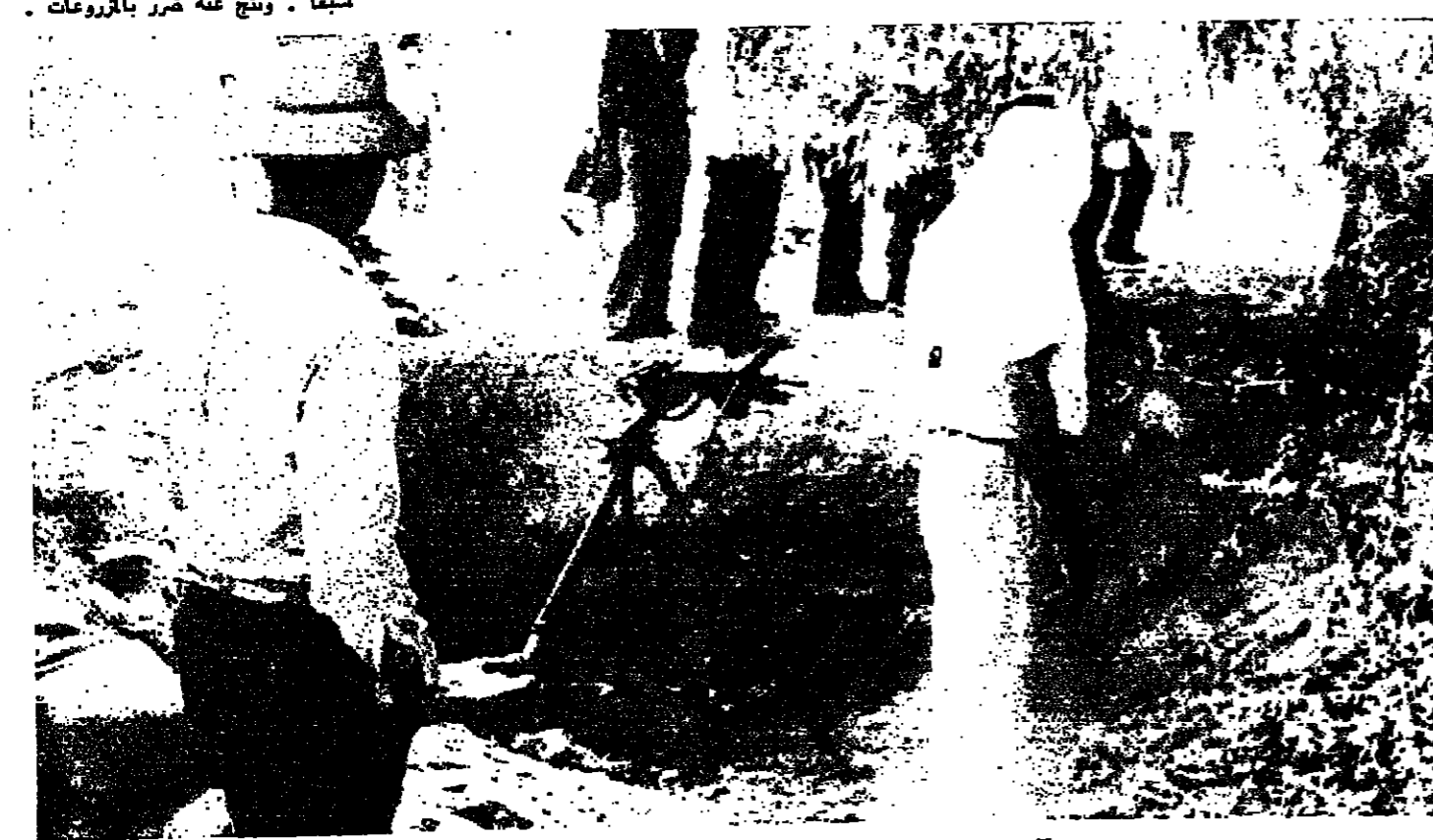
في مخيم اليبس بعد العدوان